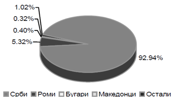
Графикон бр. 2. Етничка структура становништва

Густина насељености. Просечна густина насељености града Врања, према попису из 2002. године износи 85 становника по 1км 2 .