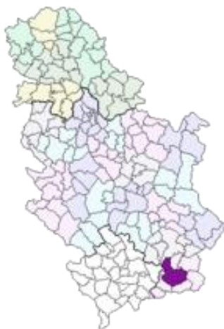
Слика бр. 1. Положај града Врања у Републици Србији

Град Врање налази се у јужној Србији, у централном делу Пчињског округа. Граничи се са 5 општина Пчињског округа: на северу са општинама Владичин Хан и Сурдулица, на западу са општином Босилеград, а на југу са општинама Бујановац и Трговиште. У североисточном делу Врање се граничи и са 3 општине јужне српске покрајине Косово: Косовска Каменица, Ново Брдо и Гњилане.